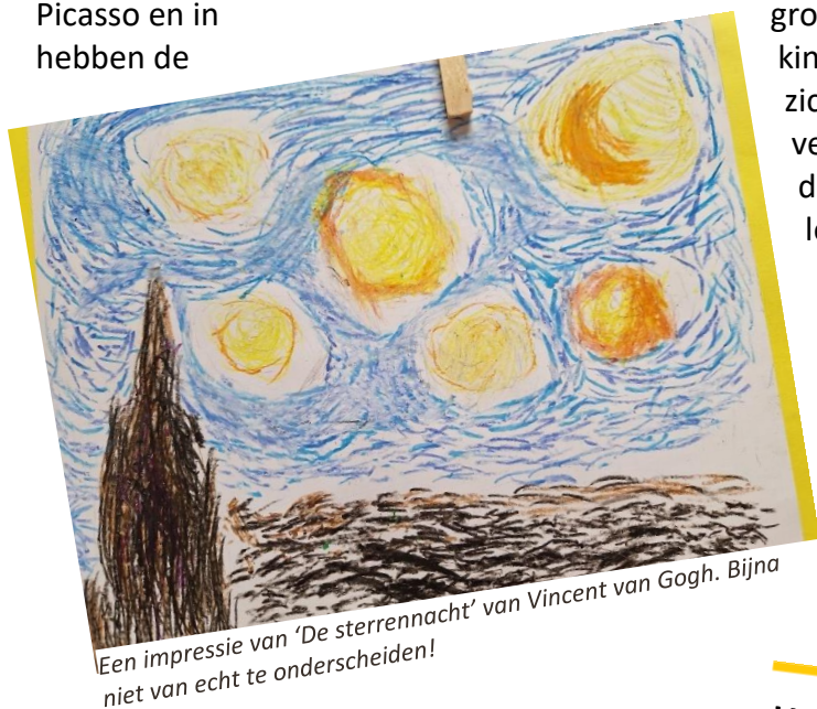
Een impressie van 'De sterrennacht' van Vincent van Gogh. Bijna niet van echt te onderscheiden!