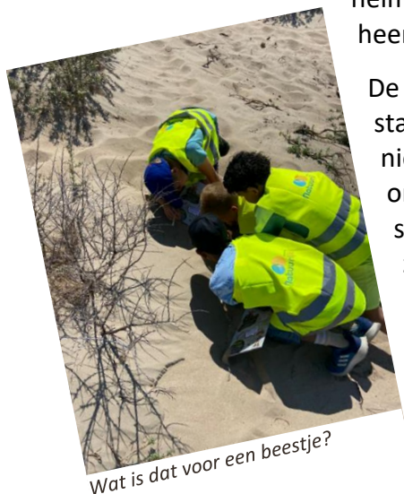
Wat is dat voor een beestje?