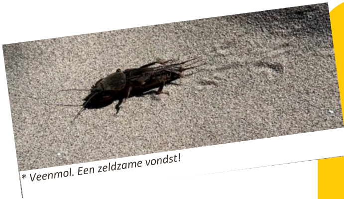
* Veenmol. Een zeldzame vondst!

We hoorden onderweg van leerlingen de leukste opmerkingen. Hieronder staan de allermooiste: