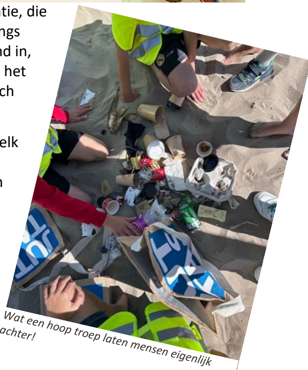
Wat een hoop troep laten mensen eigenlijk achter!

Een speciaal dankjewel aan alle ouders die hebben geholpen en gereden.